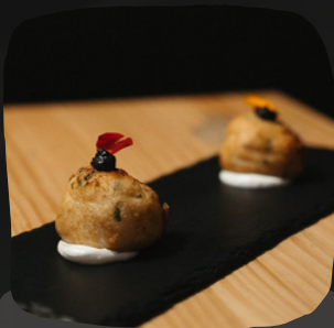
Buñuelos de bacalao con lactonesa

El wasabi es una pasta verde picante típica de la cocina japonesa.