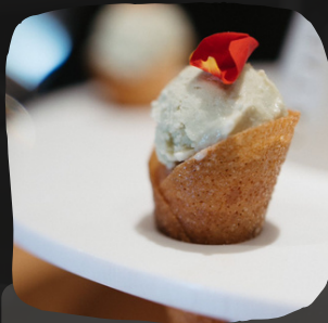
Cucurucho de salmón marinado con helado de wasabi