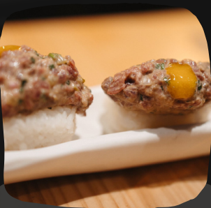
Niguiris de Steak Tartar

Los caballitos son langostinos rebozados en una rica masa.