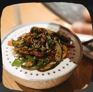
Verduritas salteadas al wok con soja

Parmentier es una crema hecha con patata típica de la gastronomía francesa.