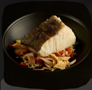
Bacalao a baja temperatura con verduritas