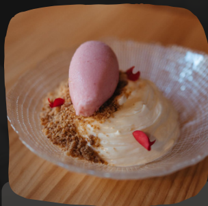
Tarta de queso a la antigua con helado de fresa