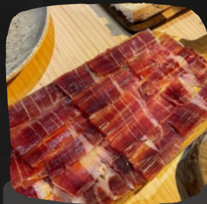
Jamón ibérico de cebo de campo al corte