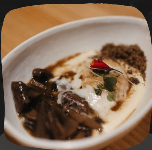
Huevo 62º-50' con parmentier trufado y setas

El salteado al wok es la técnica de cocina más conocida de la gastronomía china.