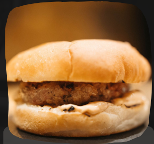
Hamburguesa de ternera madurada (80 gr)