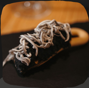
Marinera negra y gulas al ajillo