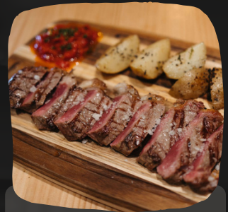
Entrecot de vaca a la parrilla con patatas