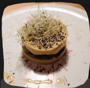
Humus de aguacate, tartar de remolacha y su sangre