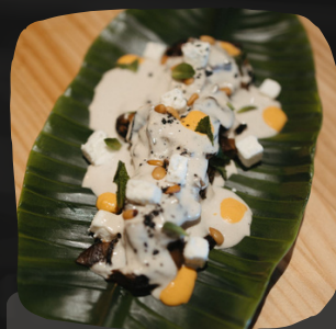
Berenjena a la llama, romesco y queso feta

Parmentier es una crema hecha con patata típica de la gastronomía francesa.