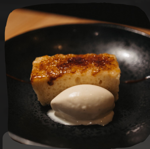
Torrija caramelizada, crema de arroz con leche y helado de vainilla