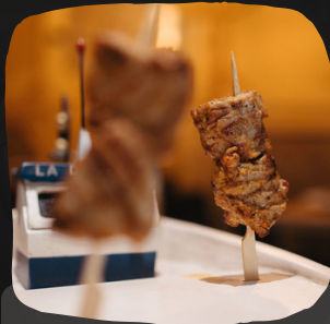
Pincho moruno de atún