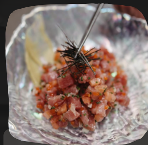
Tartar de atún, puré de aguacate y concassé de tomate