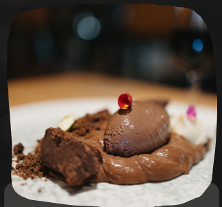
Chocolate en texturas