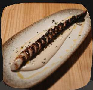
Pulpo a la parrilla con parmentier de patatas

El concassé es una técnica especial con la que se cocina el tomate y otras verduras.