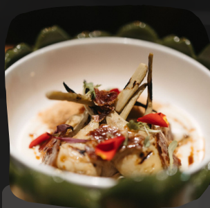
Alcachofas a la parrilla con jamón, crema de queso y reducción de vermú