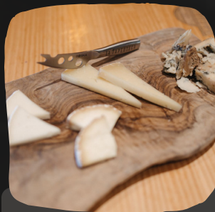
Tabla de quesos murcianos