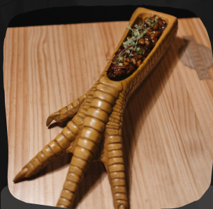
Alitas de pollo deshuesadas con manzana salteada y teriyaki