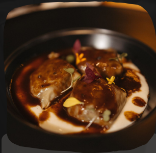
Raviolis de rabo de toro con puré de patata