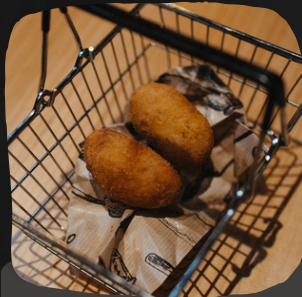
Croquetas cremosas de jamón ibérico